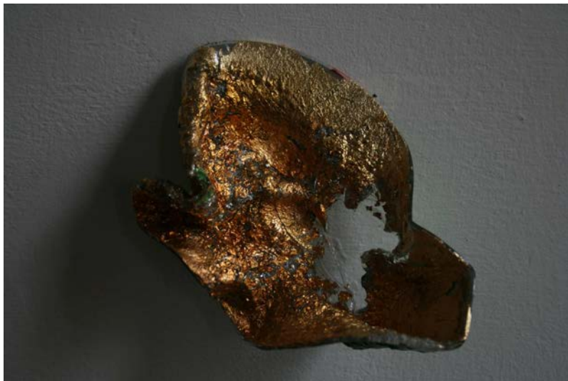
VIVIANA BERTANZA (PARTICOLARE)